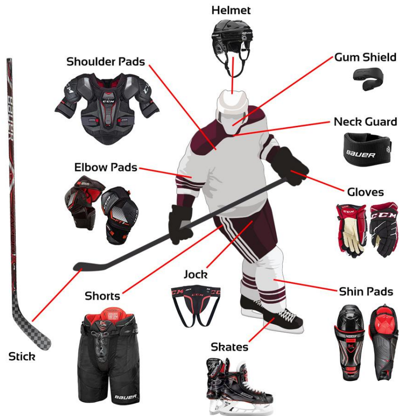
Необходимы 23 комплекта хоккейной экипировки игрока