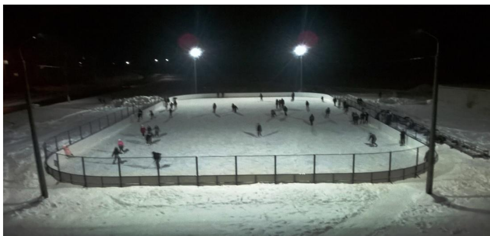
Работа ледового катка в вечернее время