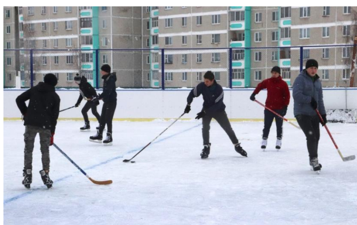
Использование коробки в зимний период