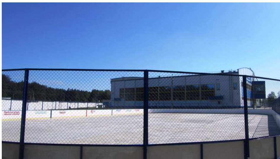
Хоккейная коробка (30 x 60 м.)