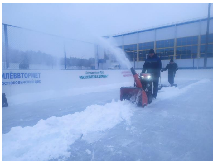
Подготовка коробки к соревнованиям