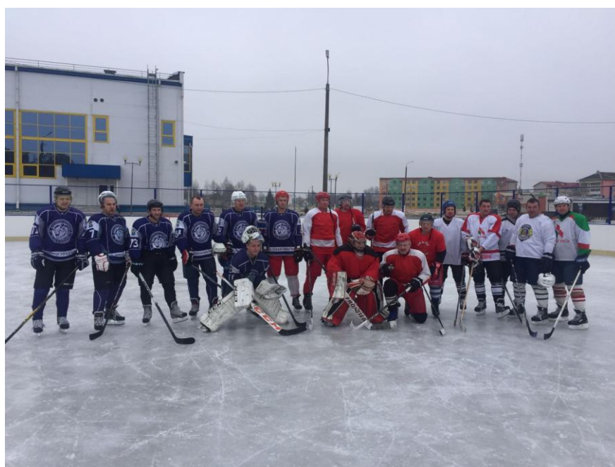
Товарищеские встречи по хоккею среди ветеранов